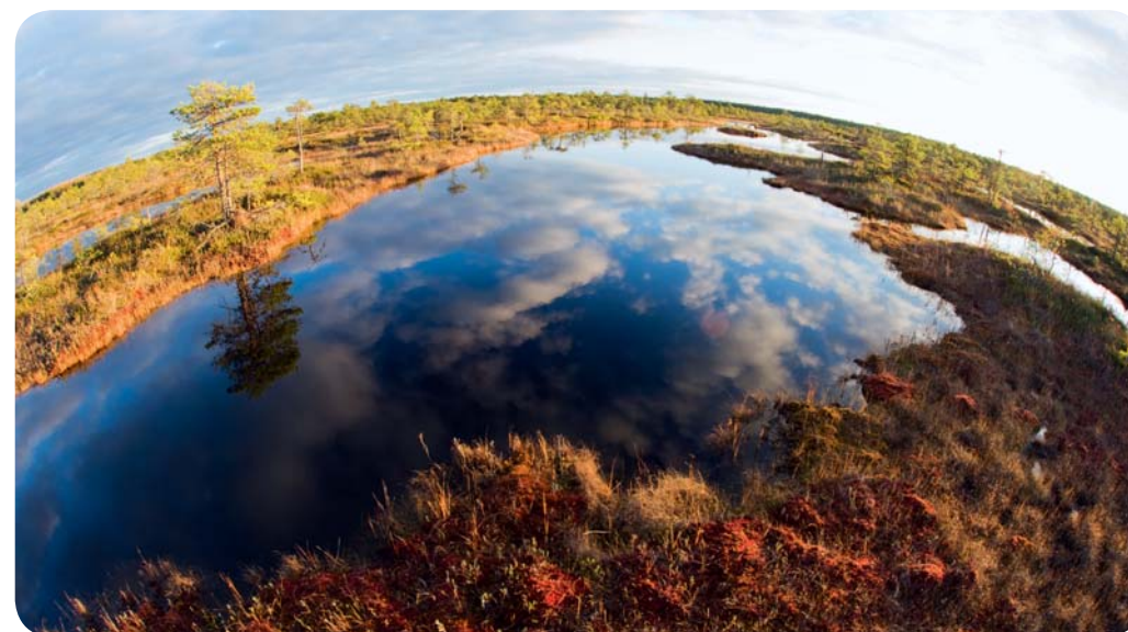
Вечерний вид на болото