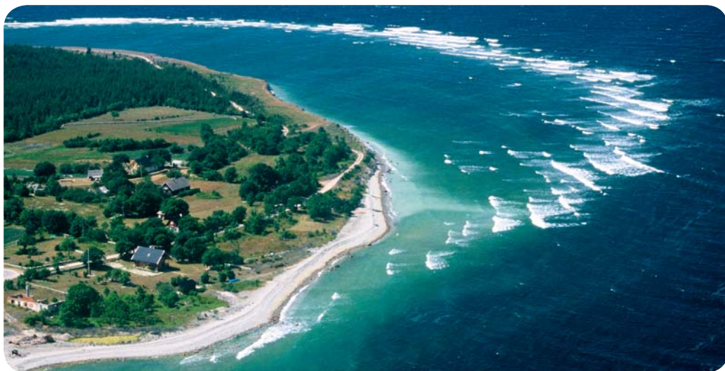
Береговая линия острова Сааремаа