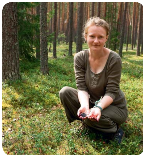
Пригоршни черники и брусники

Если Эстония – воистину царство болот, то ее царь – конечно же, Соомаа (дословно – «земля болот»), где их целых пять. Крупнейшее и самое известное – болото Куресоо, площадью 10 000 гектаров. Национальный парк Соомаа