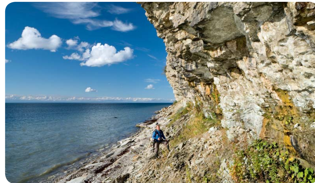
Известняковый клиф в северной Эстонии

Под действием эрозии сланцевые почвы северной Эстонии сформировали карст ,