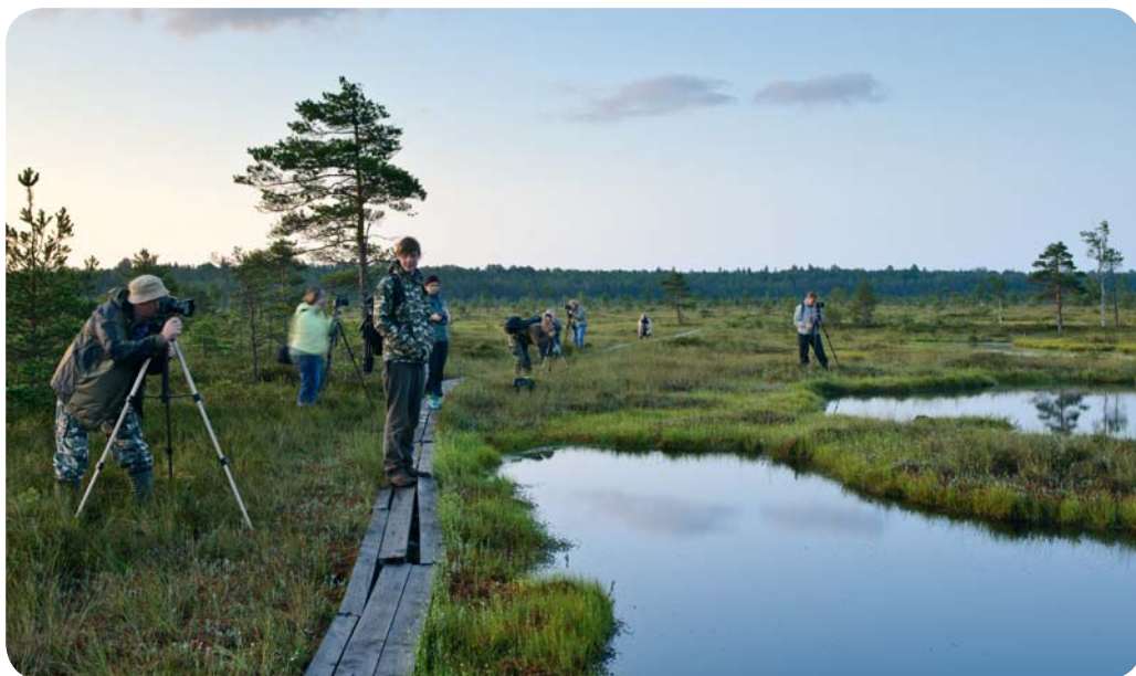
Любители природы на болоте Нигула

Эстонию с легкостью можно назвать царством болот , поскольку ими покрыта приблизительно четверть территории. От любой точки материковой Эстонии до ближайшего болота, как правило, не больше 10 км.