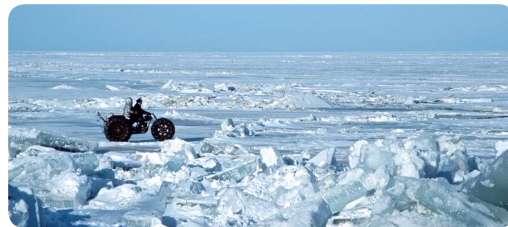
Рыбаки на Чудском озере

Летом на берега тепловодных озер съезжаются любители позагорать, а зимой зеркальная ледяная поверхность озер привлекает желающих покататься на коньках. На льду Чудского озера проводится традиционный ежегодный конькобежный марафон. Реки со спокойным и ровным течением популярны среди любителей гребли на каноэ, а лучшей из них считается река Выханду в южной части страны. Это и самая протяженная река в Эстонии, ее длина – 162 км.