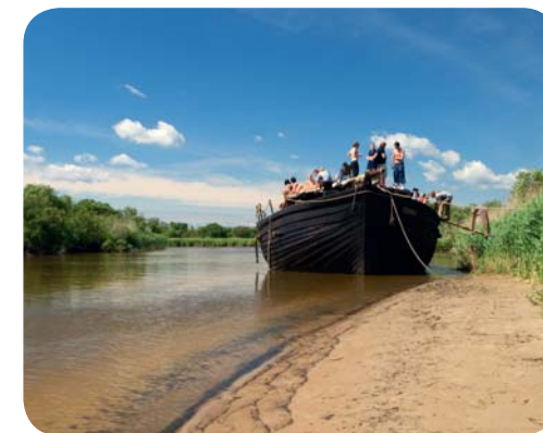
На лодке по реке Суур-Эмайыги

На восточной границе Эстонии находится пятое по величине в Европе озеро – Псковско-Чудское . Но самым красивым в Эстонии водоемом считается Пюхаярв (дословно «Святое