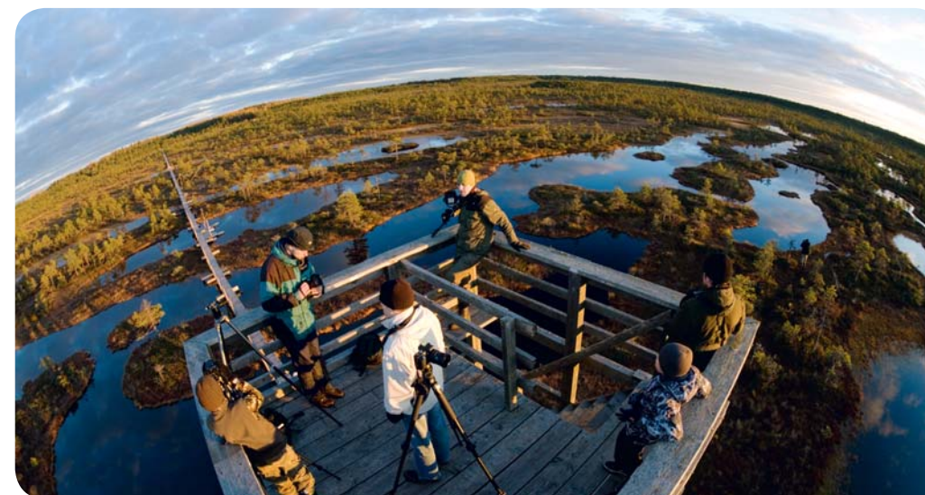
Вышка для наблюдения за птицами в природном заповеднике Эндла

мысе Сяэр полуострова Сырве на Сааремаа. В миграционный сезон эта выступающая далеко в море коса привлекает огромное количество птиц. Мыс Сяэр – важнейший ориентир для водоплавающих птиц, птиц-хищников и миллионов воробьиных . На протяжении многих лет в этом районе было замечено более 270 видов птиц – в удачные дни можно увидеть половину из них. Вот почему каждую осень на полуостров Сырве съезжаются любители птиц со всего мира!