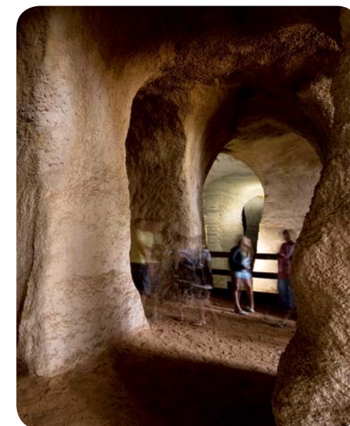
Песчаные пещеры Пиуса в южной Эстонии

природный памятник Эстонии, а также самая грандиозная группа кратеров на всем евразийском континенте. Самый большой кратер достигает в диаметре 110 метров, его глубина – 16 метров.