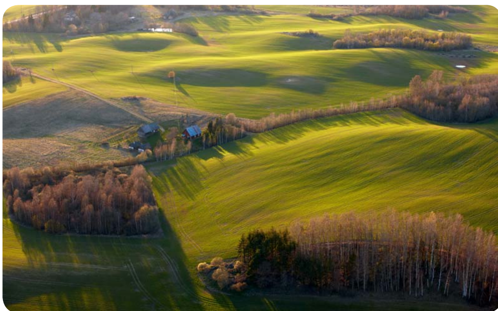
Холмистый ландшафт южной Эстонии

Ледниковый период не только принес валуны в Эстонию, но и придал поверхности ее земли удобный ему вид. Еще один шедевр, созданный льдами, а также одно из самых красивых и одно из самых высоких мест в Балтийском регионе –