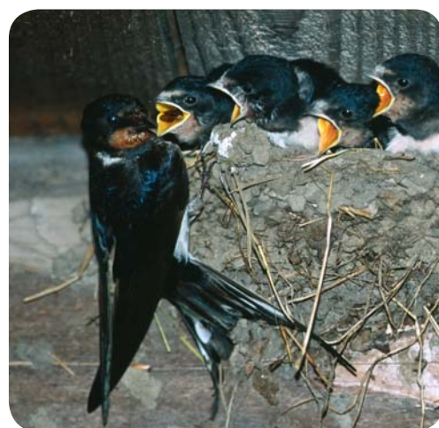
Деревенская ласточка – национальная птица Эстонии

Наблюдать за птицами легче всего в заповедных зонах с многочисленных наблюдательных вышек , так как иначе к гнездовьям часто не подобраться.