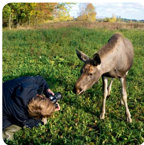
Встреча на лесной опушке

Следует также отметить, что благодаря низкой плотности населения в Эстонии никто не нарушит приятного уединения путешественника. А мобильные телефоны и доступ в Интернет, действующие по всей стране, позволят общаться с остальным миром даже из самых удаленных уголков – с диких пляжей или из лесной чащи.