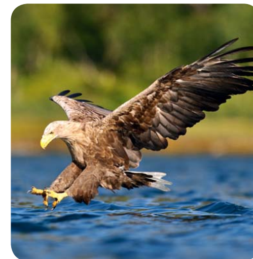
Орлан-белохвост на охоте

Высота сланцевого глинта на Эланде – всего 10 метров, но в Онтике на северном побережье Эстонии он местами достигает уже 56 метров. Самый высокий водопад на этом берегу находится в Валасте. С платформы обозрения на его срезе можно увидеть поражающие воображение геологические слои. Сланцевый берег –