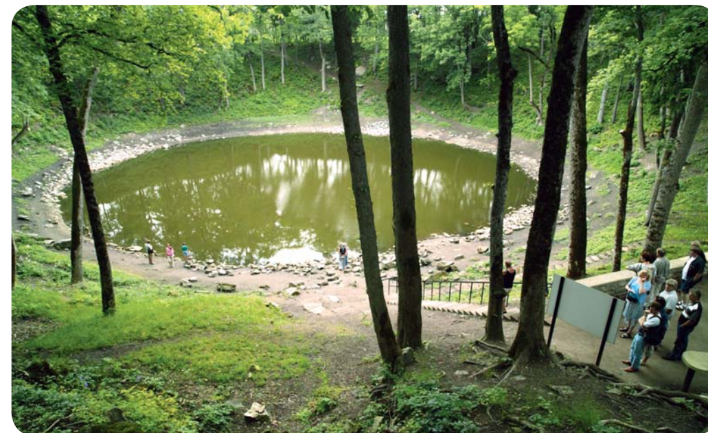
Метеоритный кратер Каали на острове Сааремаа

страна холмов южной Эстонии . Здесь один округлый холм следует за другим, некоторые покрыты полями, другие – лесами или лугами, окружающими синие озера и живописные долины. Такой идиллический ландшафт открывается взору посетителей национального парка Карула.