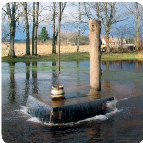
«Ведьмин колодец» в Тухала

напоминающий по своему строению швейцарский сыр. Самый большой карстовый участок находится в геологическом заповеднике Тухала . Тухала прославилась своим «Ведьминим колодцем», вода в котором «вскипает». В отдельные дни скорость воды, бьющей фонтаном из колодца, достигает 100 литров в секунду. По древнему поверью, это происходит