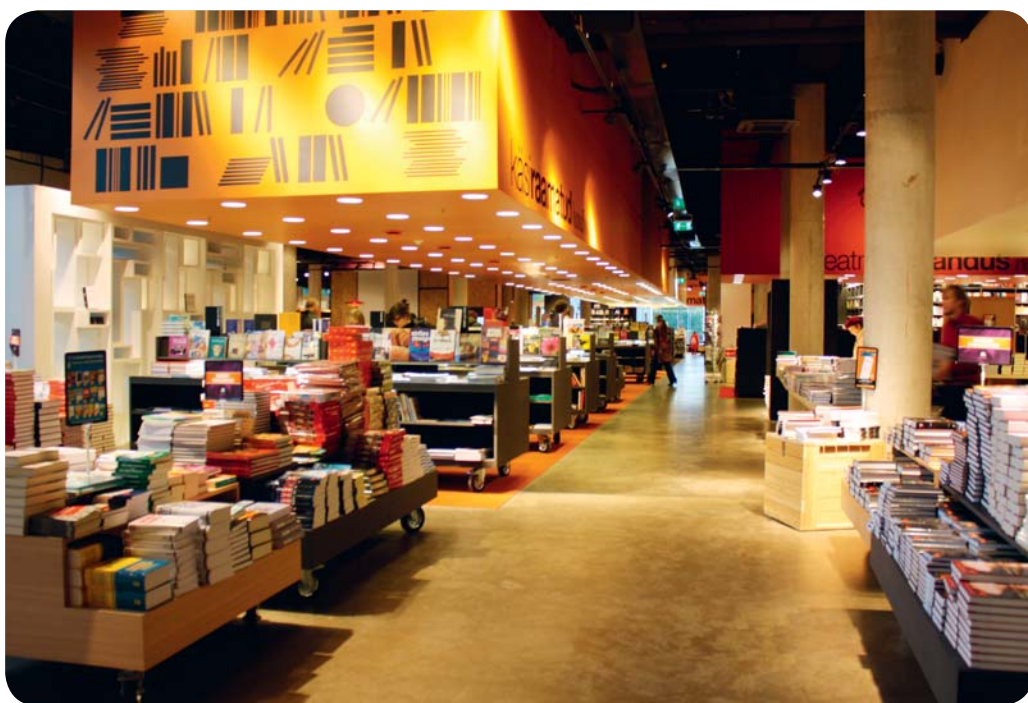
Någonting för varje bokälskare.