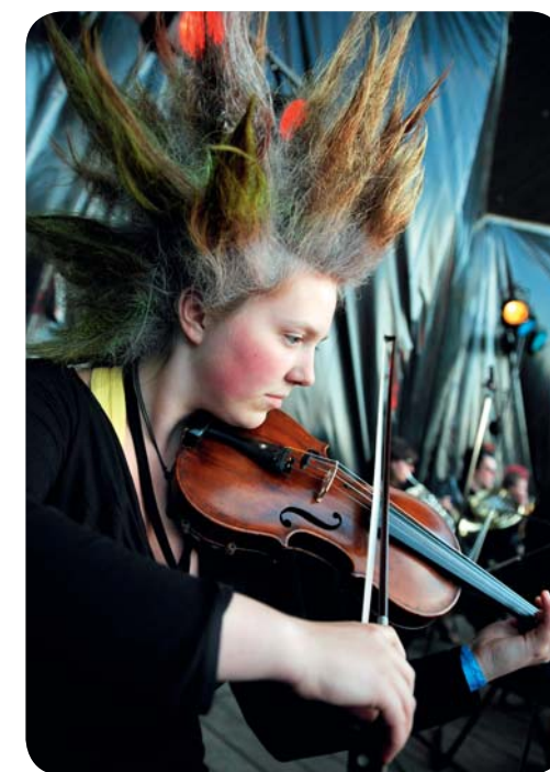
Estland har även en punkfestival.

En stor del av Estlands kulturliv utgörs av sångfestivalerna. Den största och mest välkända av dem är Tallinns sångfestival, som arrangeras på sångarfältet vart femte år och består av en samlad kör på mellan 10 000 och 20 000 sångare. Samtidigt är det 100 000-tals personer som lyssnar, vilket är helt makalöst med tanke på att Estland bara har drygt en miljon invånare. Den allra första sångfestivalen hölls i Tartu 1869, i och med landets gryende nationalkänsla, och ända sedan dess har estländarna regelbundet samlats för att sjunga och dansa. Över hela landet arrangeras större och mindre festivaler på sommaren och det finns till och med en punkfestival, även om majoriteten är helt inriktad på folkmusik. För estländarna är sångfestivalerna inte enbart ett stort arrangemang utan lika mycket en symbol för deras frihetskamp. Den senaste festivalen i Tallinn, som hölls i juli 2009, lockade till sig mer än 37 000 deltagare.