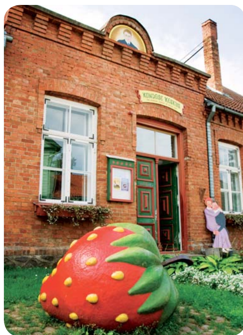
Kondas center för naiv konst i Viljandi.

hittar du i Pärnu. Staden kallas också för Estlands sommarhuvudstad och medan Tartu blir mer tyst och stillsam när universitetet stänger under sommaren lever Pärnu upp och blir livligare än någonsin. Inom bara en kort prome-