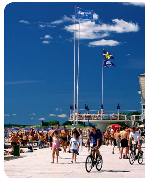
Pärnu är Estlands sommarhuvudstad.

nads räckhåll kan du förutom alla stränderna besöka konstgallerier, konserter och nattklubbar. Här erbjuds du sval elegans och pulserande nattliv sida vid sida.