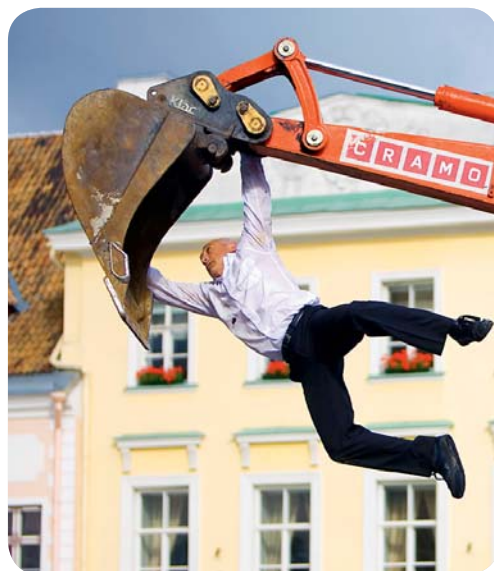
Allt kan hända under den internationella dansfestivalen i augusti.

som är värt att hålla ögonen på. Den pågår inte under en specifik vecka utan är utspridd i mindre evenemang över hela året. Jazzkaar lyckas numera dra till sig de största världsnamnen tillsammans med det bästa som Estlands musikscen inom jazzen har att erbjuda. Men den mest anmärkningsvärda festivalen är Viljandis