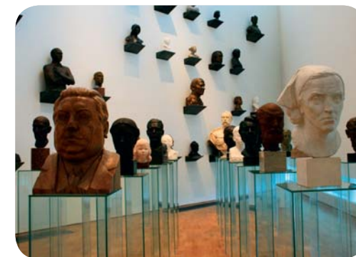
Utställning på Kumu konstmuseum.

För den som är intresserad av konst är det perfekt att börja med Tallinns konsthus i Estlands mest välbevarade funktisbyggnad från 1930-talet. Fortsätt härifrån till Kumu konstmuseum, som har den största konstsamlingen i Baltikum och blivit utsedd till Europas bästa museum 2008. Kumu konstmuseum ligger strax intill den vackra Kadriorgparken och visar det allra bästa inom estnisk konst. Det är ständigt nya, spännande utställningar på gång. Sedan är det bara ett kort promenadavstånd till det fantastiska barockslottet med tillhörande parkområde, barnens park och Mikkelmuseet med en intressant samling av utländsk konst.