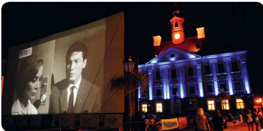
Tartu har en egen festival för kärleksfilm.