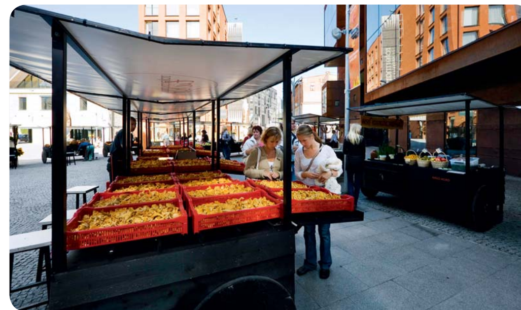
En av alla marknader som finns i Tallinn, i distriktet Rottermann.

tatis skulle kunna skriva under på att det estniska köket är delikat. Det är den unika kombinationen av enkla, noga utvalda råvaror som är hemligheten.