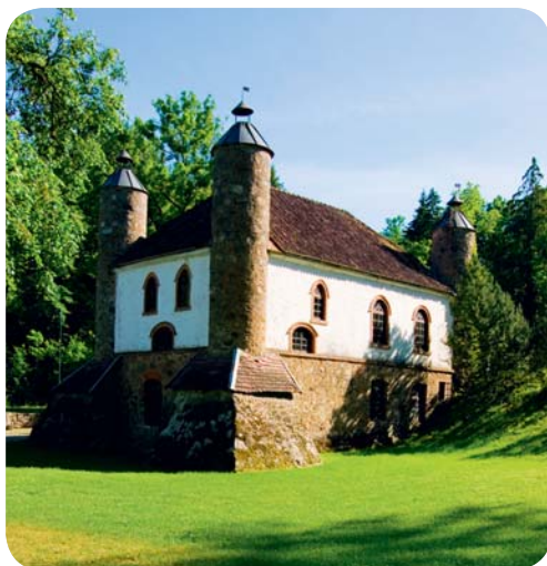
Intressant arkitektur finns över hela Estland.

ölet, tillverka vodkan och ansvara för andra nödvändiga sysslor.