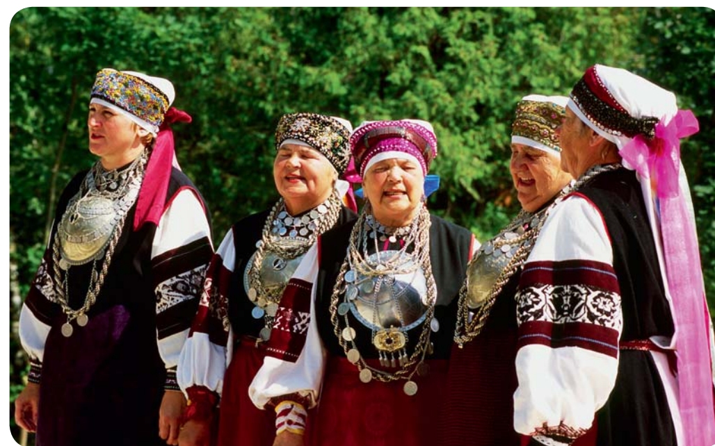
Seto-kvinnor sjunger sina traditionella folksånger.

Setumaa ligger i den sydöstra delen av Estland, och är historiskt sett en ortodox region, vilket har gjort att den urgamla Setokulturen har bevarats. Det gäller allt från det speciella sättet att sjunga på och ett mycket ålderdomligt språk, till folkdräkter och smycken och sist men inte minst kokkonsten. För den som vill veta mer går det bland annat att fördjupa sig i ämnet på Värska lantbruksmuseum. Men inget går naturligtvis upp mot att uppleva Setofolkets kultur i någon av byarna. Resan hit lönar sig särskilt under de olika traditionella högtiderna och festligheterna. Framför allt under årets största händelse, Seto Kungadömes dagar, när Setofolket ska välja sin egen regent för det kommande året. Här bestäms även vem som ska brygga