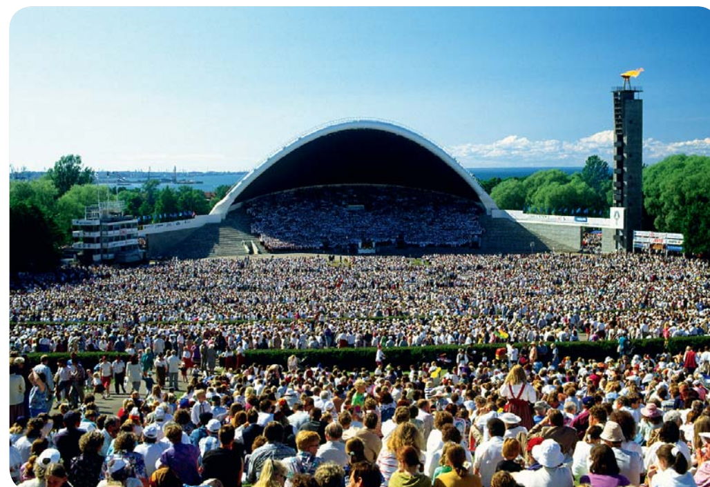
Sångarfältet i Tallinn under en av festivalerna.