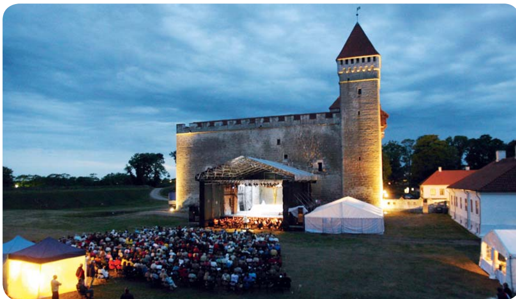
Ösels operafestival i Kuressaare.

Samtliga av dessa regioner passar även för en längre semester – och alla sevärdheter är lätta att ta sig till med bil (eller en lite mer tidskrävande cykeltur). Det är inte svårt att hitta ett trevligt hotell eller ett bra ställe att äta på – för att uppleva kultur på avstånd från stadsbruset, men ändå mitt i vardagslivet.