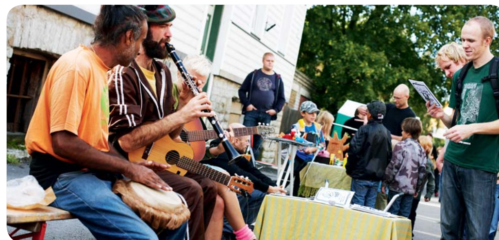
En av alla gatufestivaler som arrangeras i Tallinn.