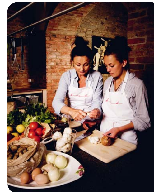
Matlagning i det estniska köket.

Vem som helst som har smakat rökt, estnisk skinka eller baltisk kryddsill och färsk, kokt po-