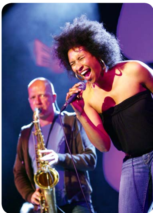
Den populära jazzfestivalen Jazzkaar.

En av de största festivalerna i Estland är den internationella Black Nights Film Festival (PÖFF), som under årens lopp har vuxit och blivit omtalad i Europa – inte för dess storlek utan för filmernas höga kvalitet och det intressanta urva-