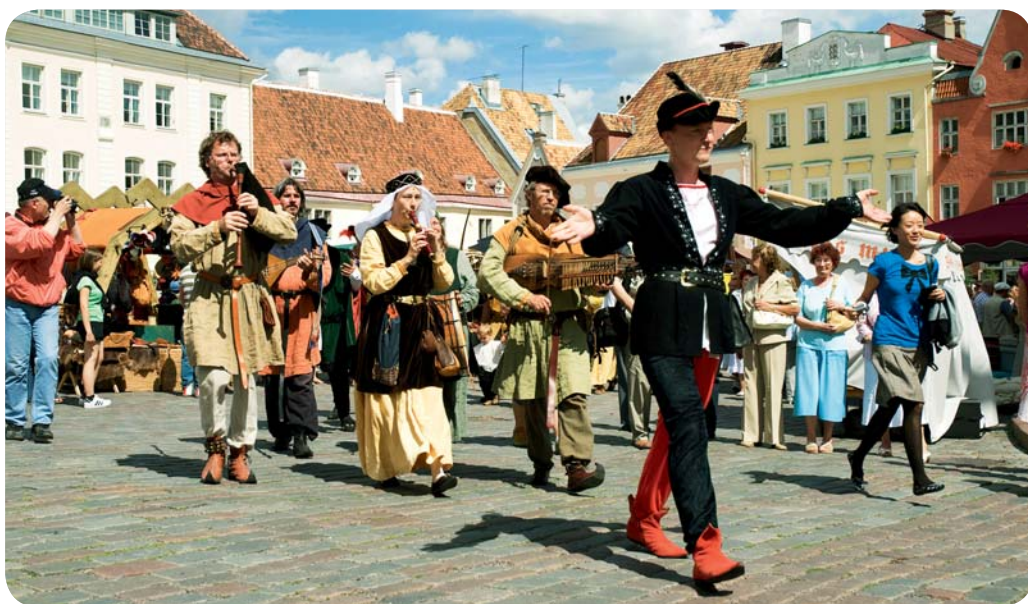
Medeltidsdagar på Stadshustorget.

se ut som det gör utan landets dramatiska historia, vare sig det handlar om sången, poesin eller litteraturen. Men samtidigt är det inte svårt att upptäcka Estlands speciella egenart, i allt från byggnadsstilen hos en gammal lada till moderna huskroppar i glas, från mönstret i en handstickad vante till interaktiva lösningar på Internet.