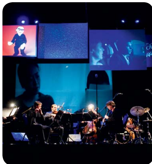
International Black Nights Film Festival i Tallinn.

För dig som älskar jazz äger den internationella festivalen Jazzkaar rum varje år och är något