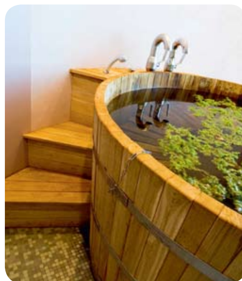
En härlig badtunna.

badtunna eller i en bastuhydda i indiansk stil under en klar natthimmel. Vid många av floderna och sjöarna kan man även se en liten skorsten som skjuter upp från en bastu som är förankrad på en flotte. Sådana flytande bastubad har blivit en stor turistattraktion i sig.