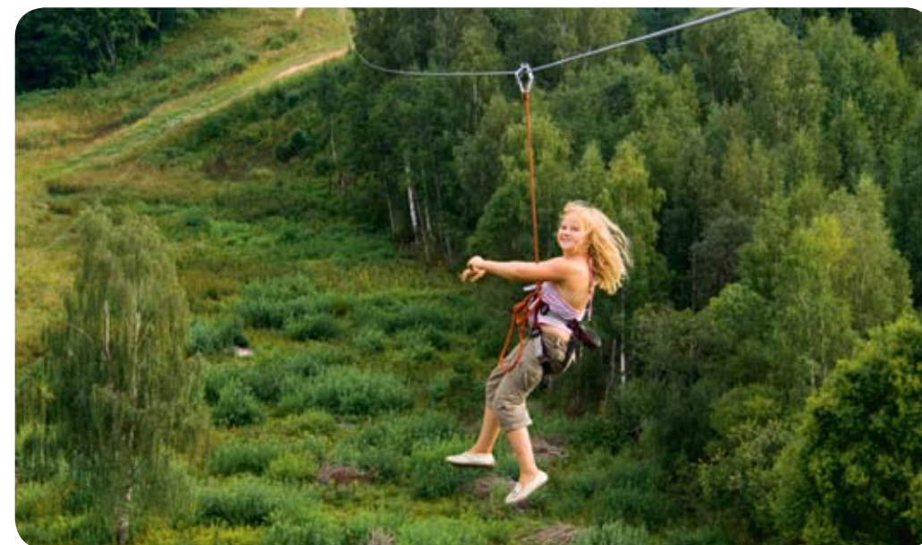
Äventyr högst upp i trädtopparna.

I den moderna och högteknologiska värld som vi lever i är det också lätt att förlora insikten om att vi är en del av naturen. Om vi inte tar hand om oss, motionerar, äter bra, får tillräckligt med dagsljus och frisk luft börjar vi snabbt att vissna. Det är också viktigt att vi får ägna oss åt det som vi känner en passion för, och att vi ibland går utanför våra upptrampade stigar och vågar prova något helt nytt.