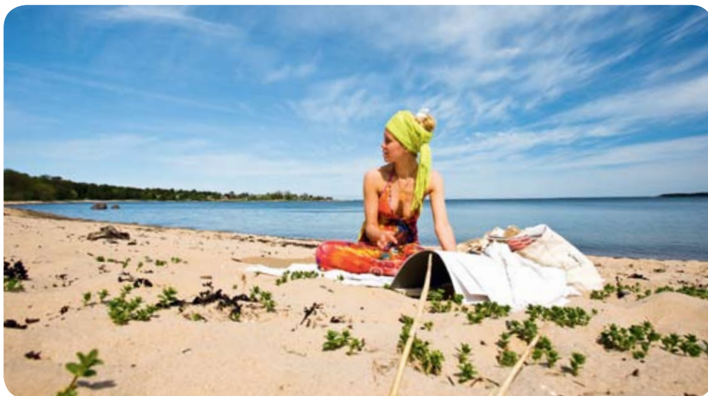
Vackra sandstränder så långt ögat kan nå.