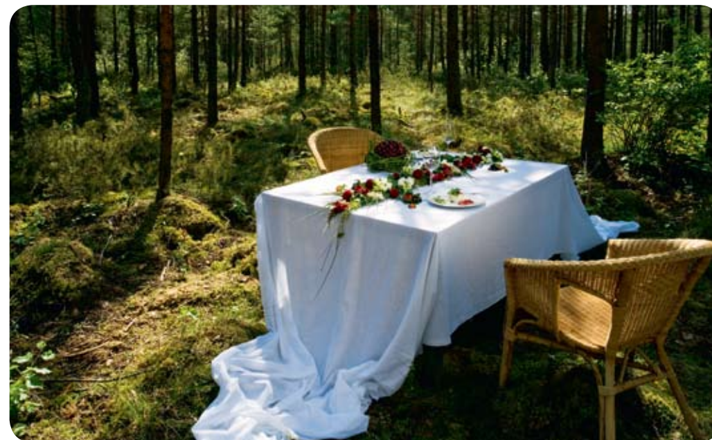
Middag med estniska råvaror.

Estland har även gott om härliga vandringsleder, som används till så mycket annat än att vandra på. Många föredrar i stället att jogga och åka skidor eller ta kortare promenader utan att behöva campa. Dessutom har lederna ofta försetts med intressanta informationstavlor om den särpräglade naturen och ibland även andra turistattraktioner, till exempel snidade träskulpturer föreställande väsen ur estnisk folktro. Det gör det till ett äventyr att ta sig fram i skogarna, man vet aldrig vad som väntar bakom nästa krök.