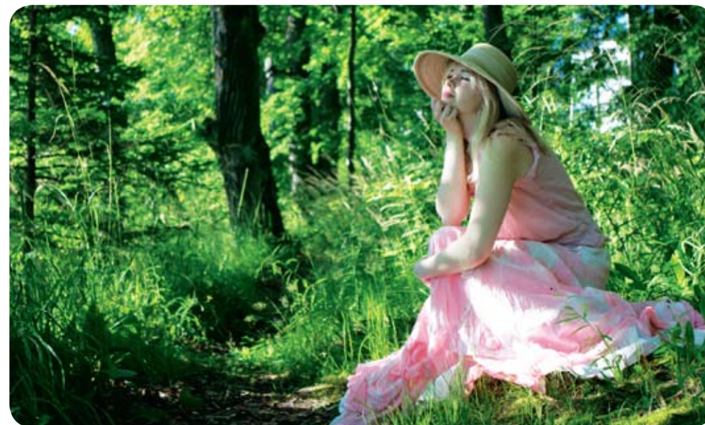
Njut av lugnet i skogarna.

föregångare när det gäller att erbjuda skönhetsvård som ett komplement till hälsoturismen.