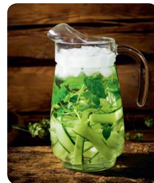
En god, stärkande energidryck.

Den höga kvaliteten märks också tydligt i köket. Skickliga och välrenommerade krögare tillfredsställer alla grupper av kräsna gäster, oavsett om man föredrar en internationell, estnisk eller vegetarisk meny.