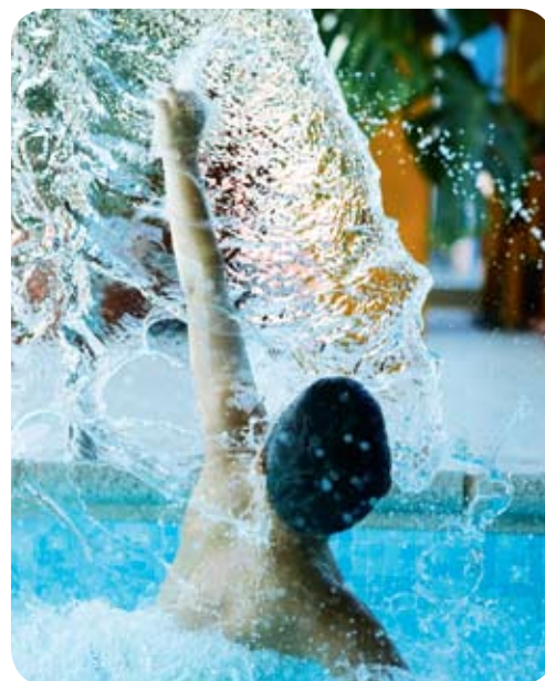
På spa-hotellen finns pooler för alla.

ran visade sig göra underverk för huden. Men förutom lerinpackningar och gyttjebad använder man även naturstenar, som har en energigivande och föryngrande effekt. På moderna, estniska spa-hotell inkluderas den mest magiska stenen av alla, shungit från Karelen.