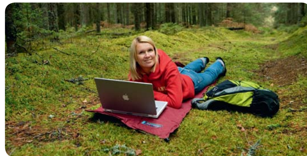
Aldrig långt borta.

På många av gårdarna kan gästerna hjälpa till med traditionella sysslor, som att väva, klippa får, spinna lin och slunga honung. Du får garanterat massor av frisk, härlig skogsluft, nyttigt kroppsarbete och trevligt umgänge. Låter det som en drömtillvaro? Det är långt ifrån en romantisk bild som målas upp för att tillfredsställa turister, precis så här ser vardagen ut för en stor del av Estlands 1,4 miljoner stora befolkning.