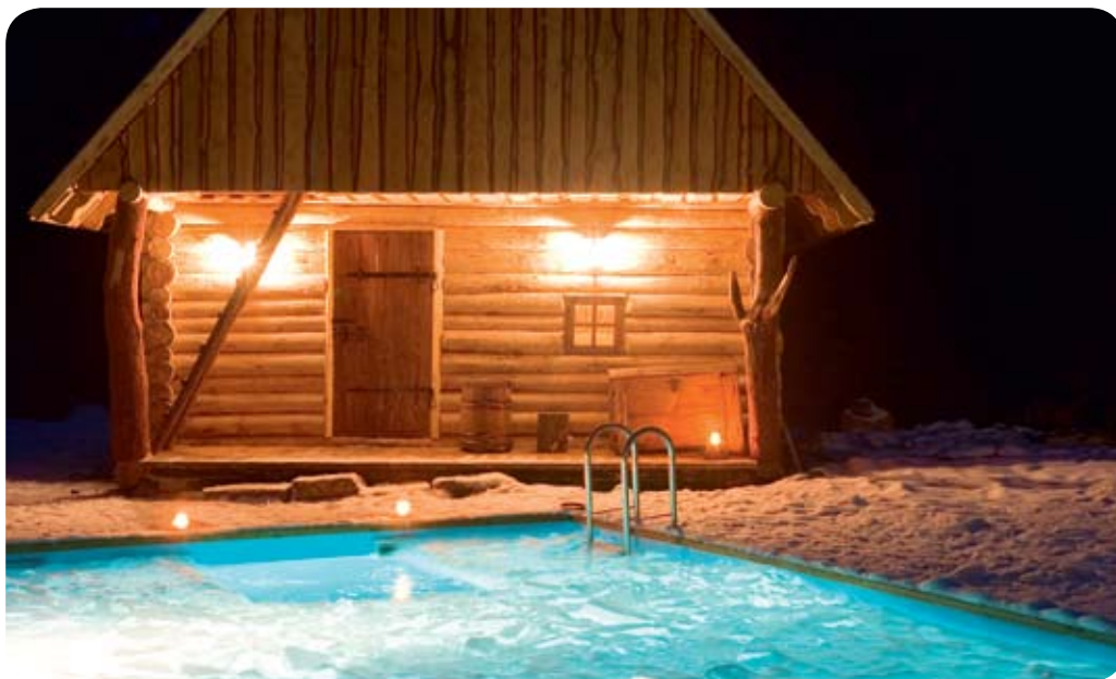
Ut ur bastun för att friska upp sig i vattnet.