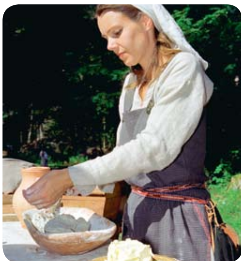
Brödbak på en turistgård.

En wellness-semester på någon av öarna, med sin orörda natur att vandra i, eller på en av de