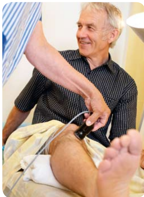
En medicinsk spa-behandling.

Det som är Estlands främsta triumfkort är att det finns så många spa-hotell, vilket även uppmuntar till att anlägga och öppna temaparker, vandringsleder, örtträdgårdar och herrgårdshotell. För en äldre person är lycka ofta lika med avsaknad av smärta. På de medicinska spa-anläggningarna finns allt från fysioterapi, kiropraktik och gyttjebad till värmebehandlingar och haloterapi – det är ett brett spektrum av behandlingar som håller högsta internationella klass.