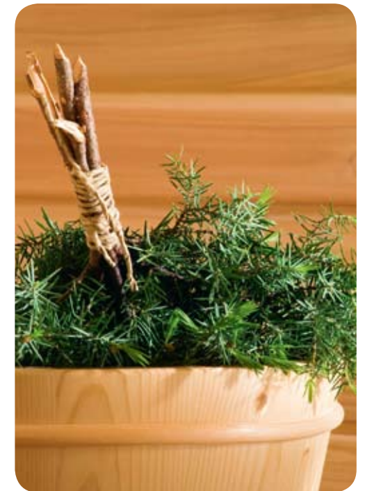
Kvistar från enbuskar blötläggas inför bustubadet.

långväga gäster frisk luft, stillhet och tystnad, och storartade naturscenerier. Samtidigt har de utvecklat en väl fungerande turistverksamhet av internationellt snitt.